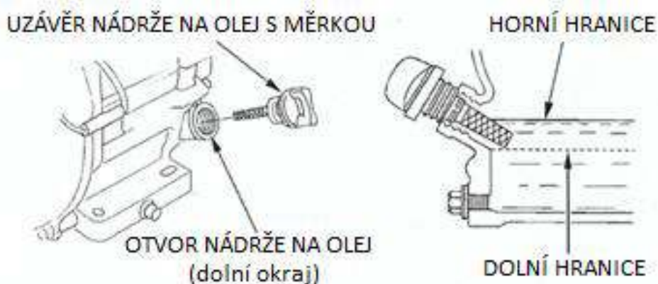
Obr. 2 Doplnění oleje

Použitý olej je potřeba vypouštět, když je motor teplý. Teplý olej bude téct rychleji a jeho zbytky nezůstanou v motoru.